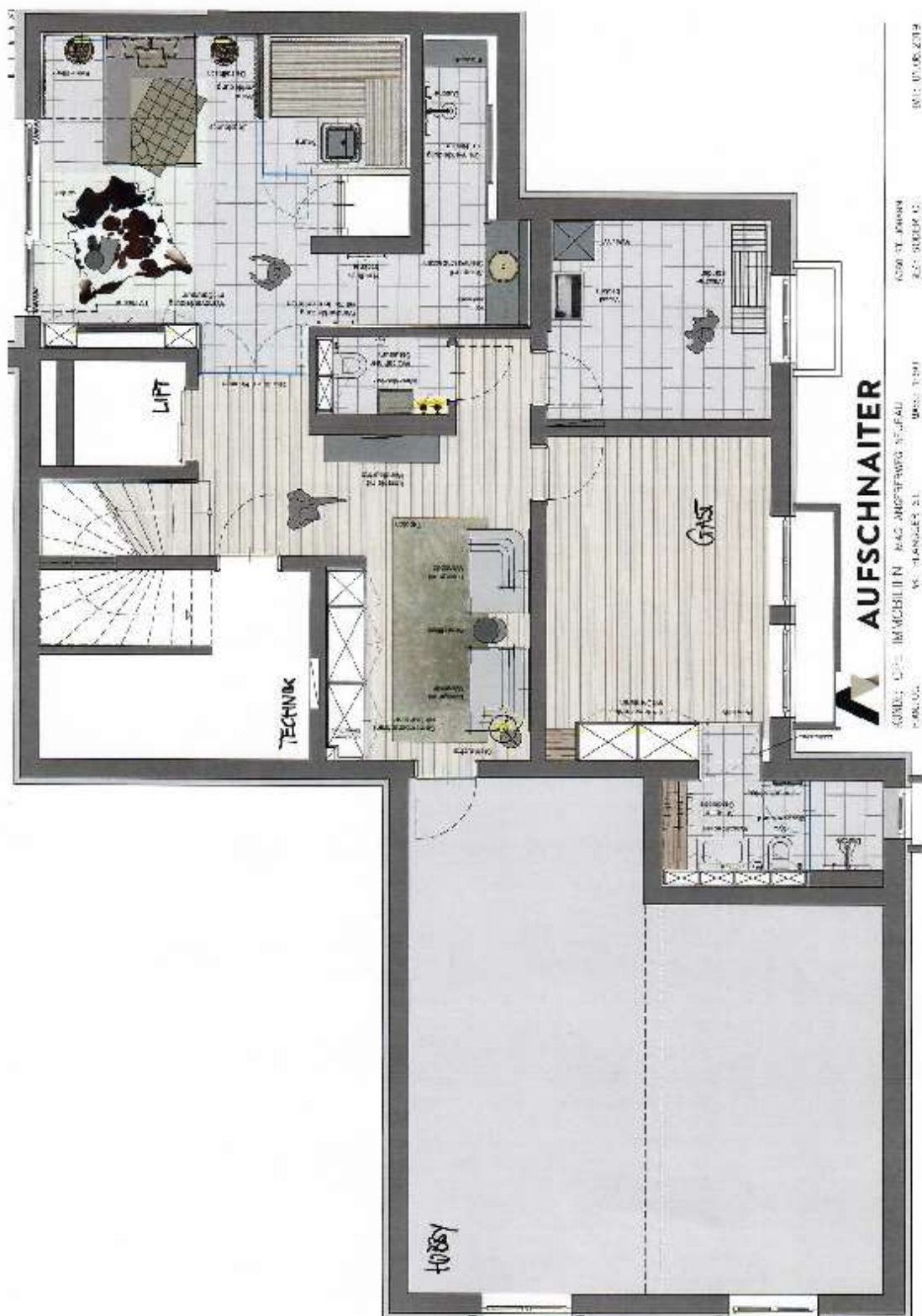
Grundriss Gartengeschoss. Die Zeichnung ist nicht maßstabsgerecht.