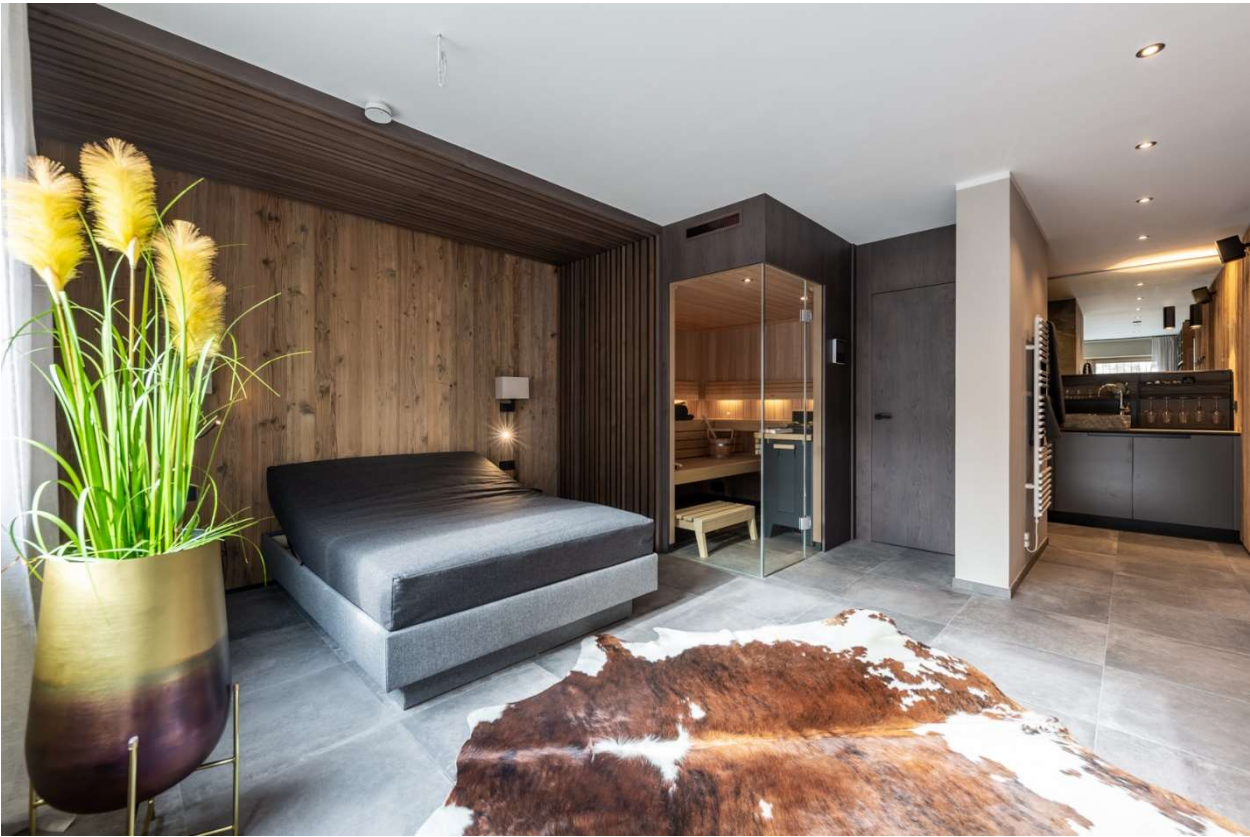
Eingerichteter Wellnessbereich mit KLAFS-Sauna und Pantry