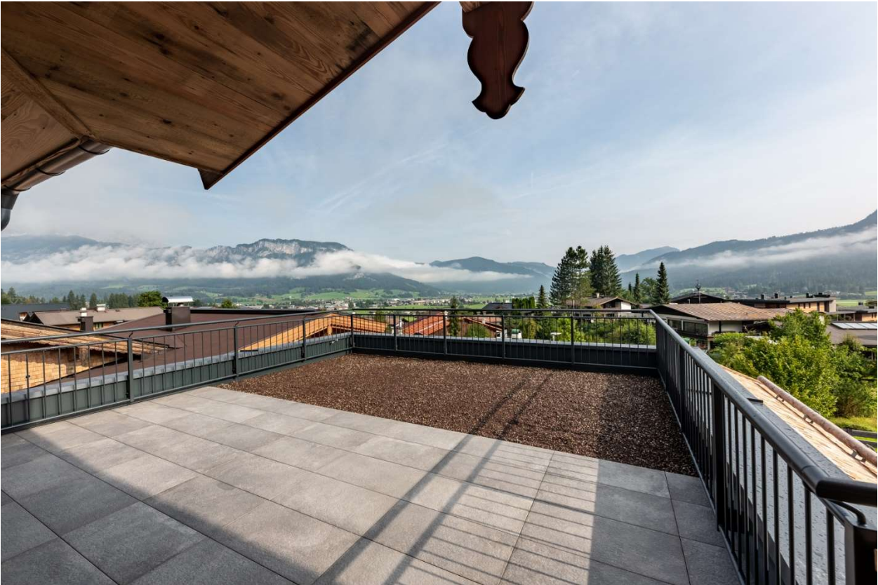
Dachterrasse und Balkone