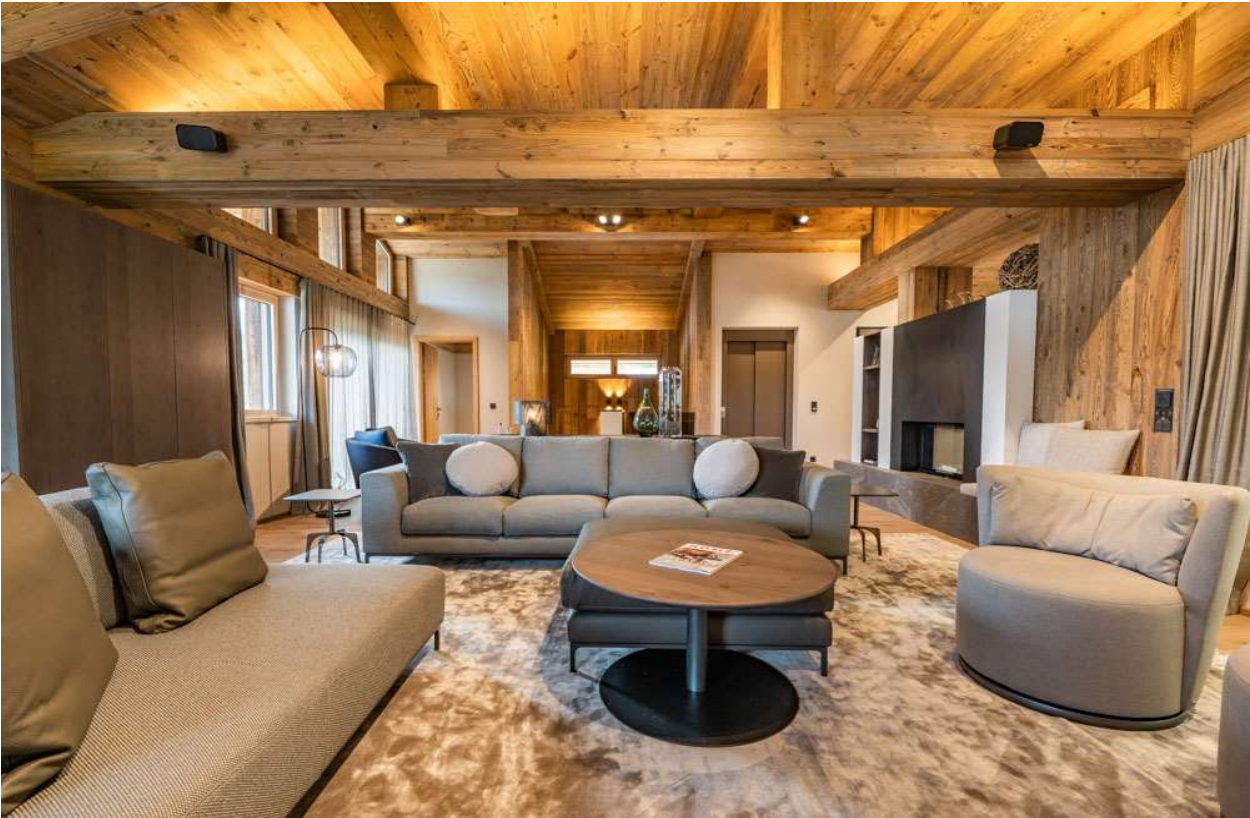
Der Wohnbereich mit zweiseitigem Kamin, Lift und Treppenhaus, auf der anderen Seite der Küchen- und Essbereich